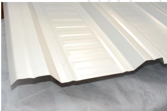
Lámina metálica galvanizada ó blanco/fondo, sujeta con pija y rondana, o bien, sistema de engargolado. También puede instalar lámina de fibro-cemento. Nota: calibre y perfil de la lámina, según diseño.

Foamular 250, de 1" de espesor (mínimo), apoyado sobre polines de 2" de patín (mínimo) con separación máxima de 1.22 m, para evitar soportes adicionales.