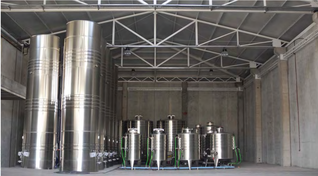
Cumple con la norma: NOM-008-ZOO-1994